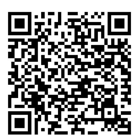
**Corona-Regelungen in den Bundesländern