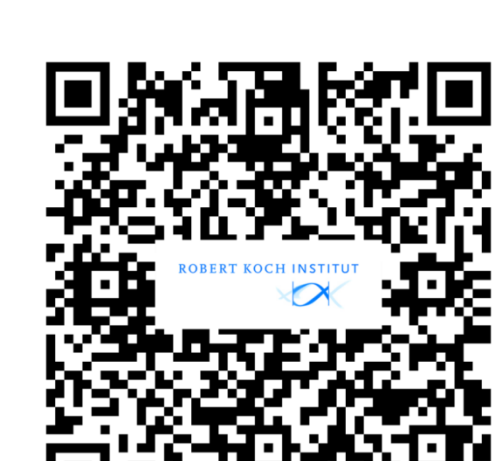
Weitere Informationen RKI