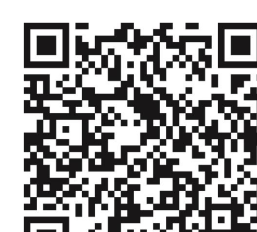
Weitere Informationen BZgA

de/themen/coronavirus/corona-bundeslaender-1745198